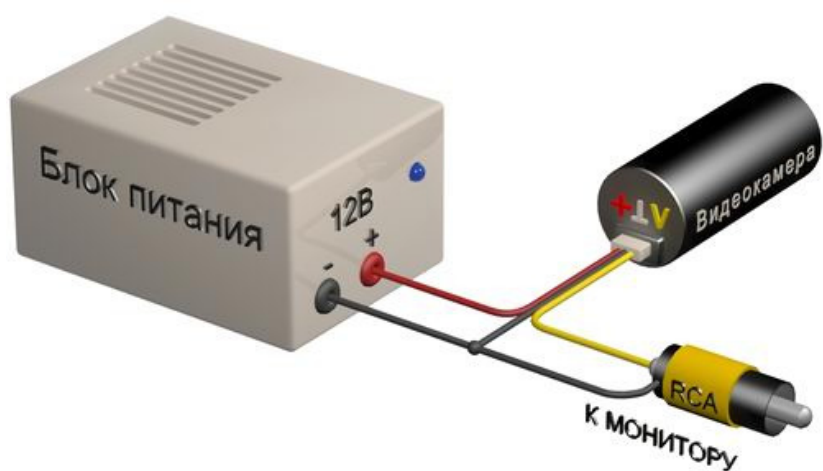
Схема подключения видеокамеры VB19BS-B36