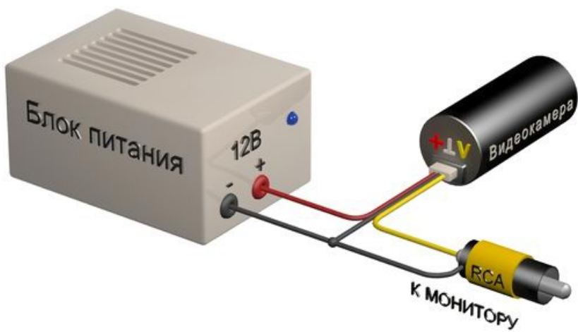
Схема подключения видеокамеры VB21CSHRX-R36