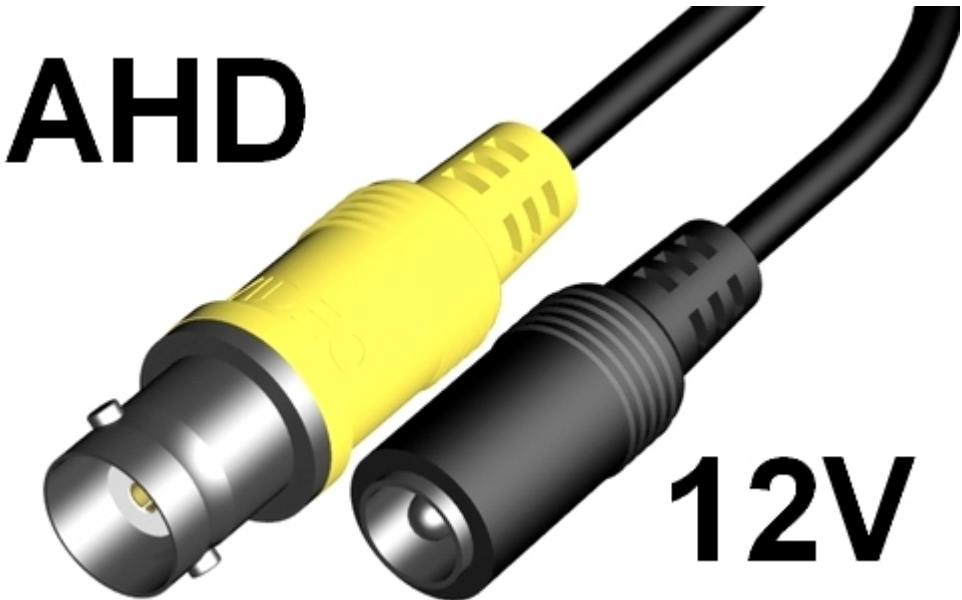
Схема подключения видеокamеры VCB-P8D2H-P4