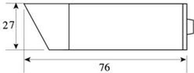
Размеры камеры видеонаблюдения VS27CH-R36