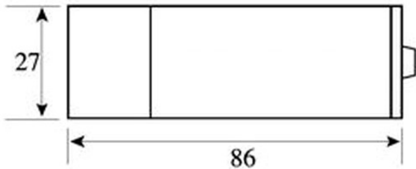
Размеры камеры видеонаблюдения VS27EH-W36